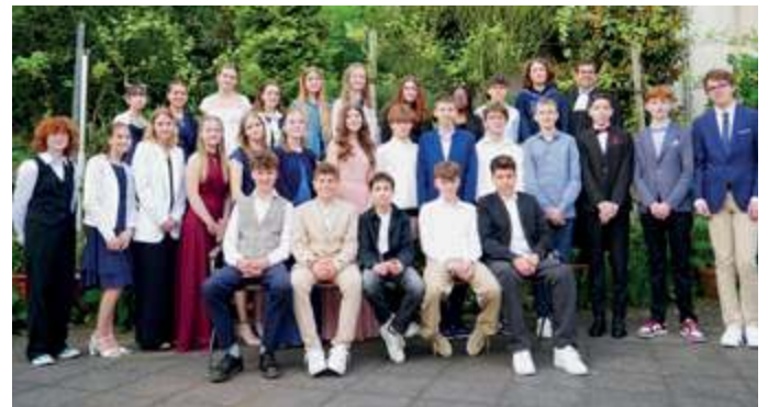
Die Konfirmanden 2024

In der Woche danach haben sich alle Konfirmanden nochmal zu einem Dankgottesdienst getroffen und sich in ihren Konfirmationsoutfits noch einmal schick gemacht.