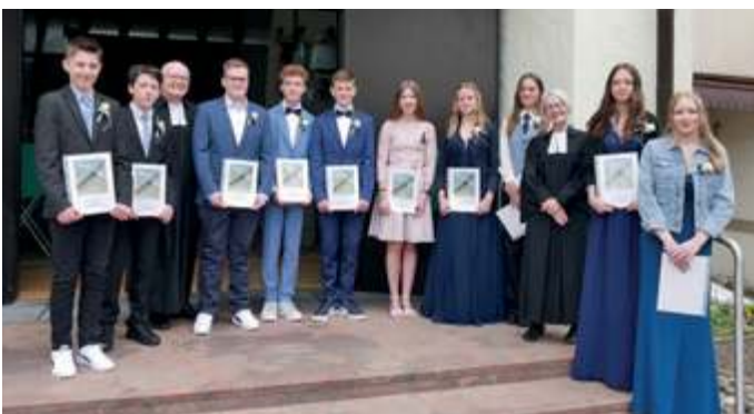
Die diesjährigen Konfis in Immenstaad

Neben der Konfirmation, dem Bezirkskonfi-Tag war sicherlich ein besonderes Highlight das viertägige Konfi-Camp in Bad Schussenried mit mehr als 150 Mitkonfis aus fast dem gesamten Kirchenbezirk.