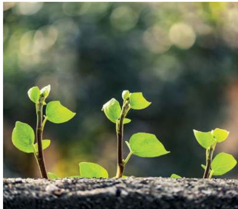
Da wächst was!