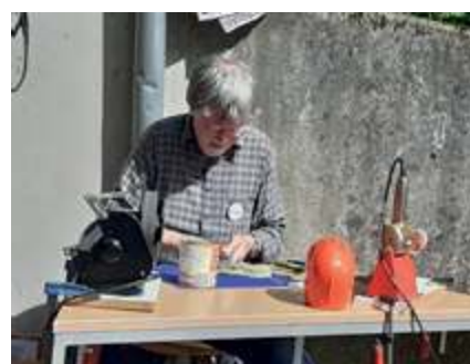
Messer- und Schereinschleifen